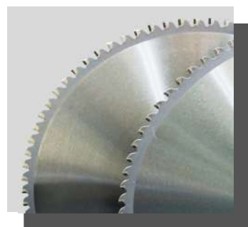
日本製チップソー