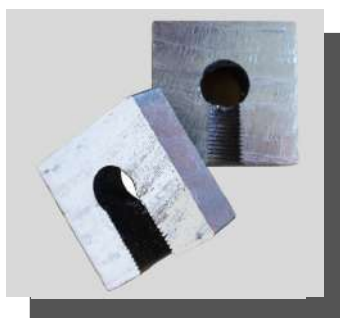
バリが少なく美しい 切断面