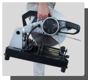
持ち運びらく らく