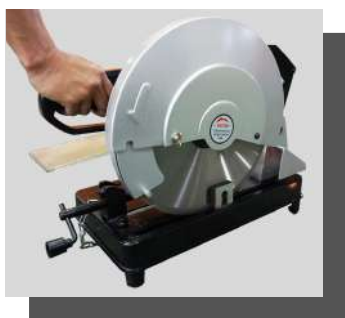
火花が散りにくく 発熱しにくい安心設計